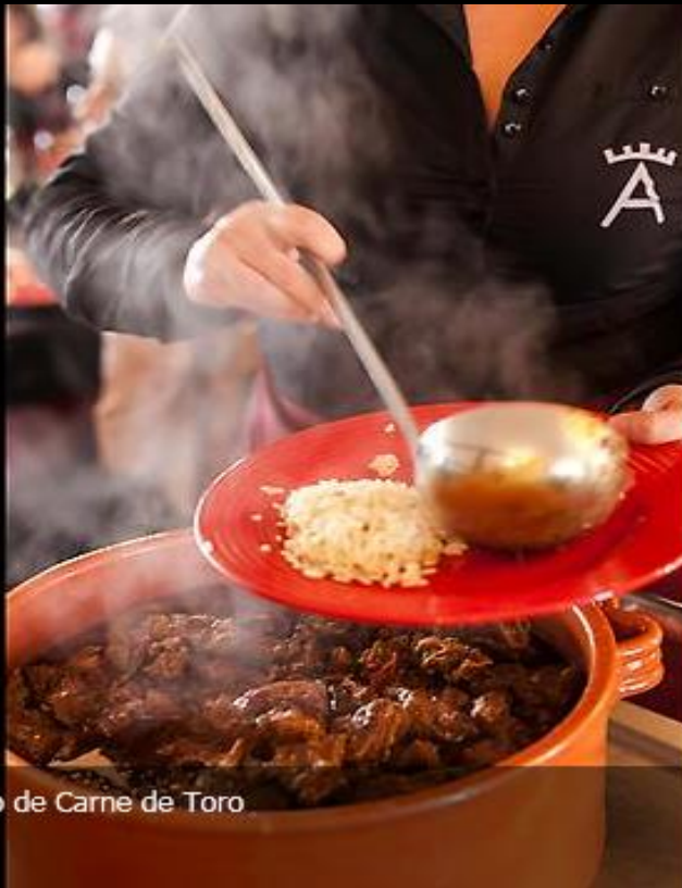
Nuestro excelente guiso de Carne de Toro